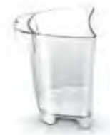
Контейнер для мякоти