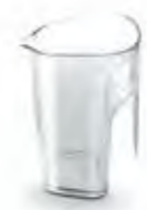
Емкость для сока